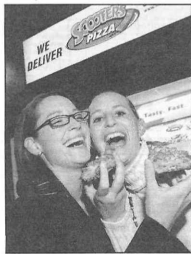
Scooters Pizza word deur die AltX-genoteerde Taste Holdings besit. Dié groep het tot dusver 'n goeie vertoning in stram ekonomiese toestande gelewer.

Verlede week het ons na twee moontlike spekulatiewe winskopie op die AltX gekyk, naamlik Huga en OneLogix. Vandag kyk ons na Simeka en Taste Holdings wat in dieselfde kategorie val. Beleggers word aangeraai om versigtig te wees en hul huiswerk te doen wanneer dié aandele oorweeg word.